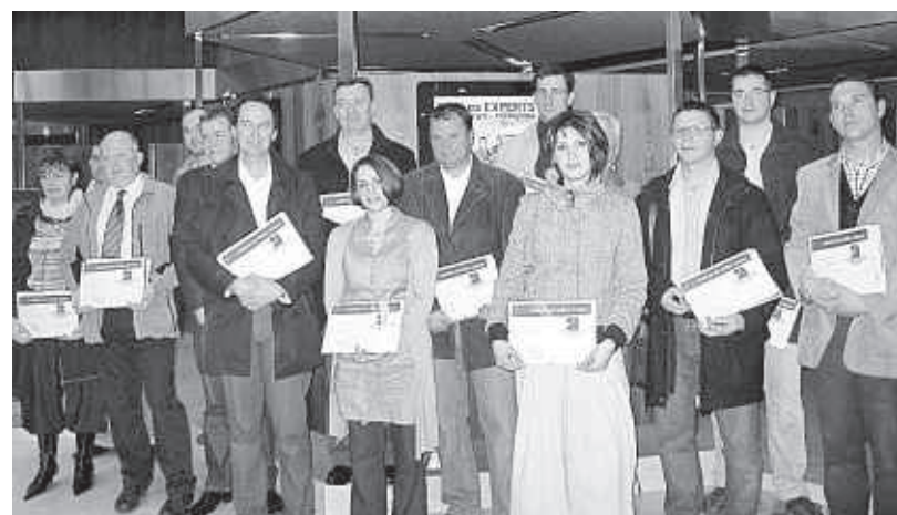
Les nouveaux maîtres artisans reçus à la chambre des métiers.

Soirée chargée pour la Chambre des métiers et de l'artisanat vendredi. Il y a eu d'abord la remise de diplômes de maîtres artisans à 24 chefs d'entreprise. Second temps de la soirée : la présentation de la huitième édition d' Artisanat mag par son président Gérard Chevalier. Cette revue annuelle de belle facture a été tirée à 40 000 exemplaires pour son édition sarthoise. Elle traite comme son nom l'indique des métiers de l'artisanat